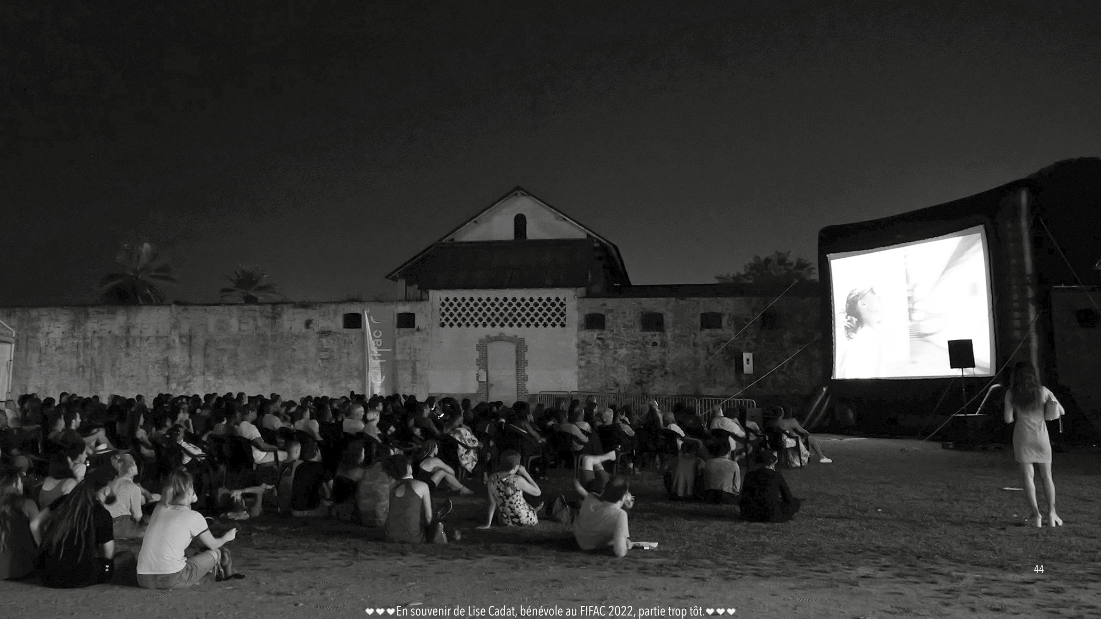
♥♥♥ En souvenir de Lise Cadat, bénévole au FIFAC 2022, partie trop tôt. ♥♥♥